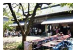
根岸家中庭と長屋門

歴史ある長屋門前で販売。素敵なお庭では、お琴の演奏、ハワイアンなど楽しめ、販売しながらもゆったり気分を味わえました。シフォンケーキ、春限定の桜のパウンドケーキ「友山桜」も好評でした。(R)